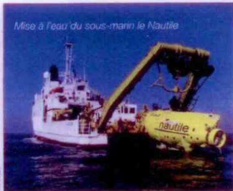
Mise à l'eau du sous-marin le Nautile

Labellisé en 2005, le Pôle Mer PACA est devenu un acteur incontournable des politiques de développement durable et de sécurité maritime en Méditerranée