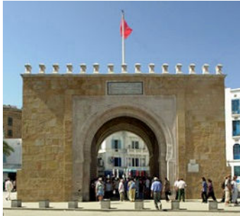
Bab Bhar aussi connue sous le nom de «Porte de France», à Tunis